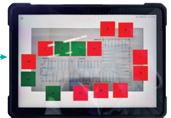
必要なときに必要な場所へ散水可能(緑色:散水中)