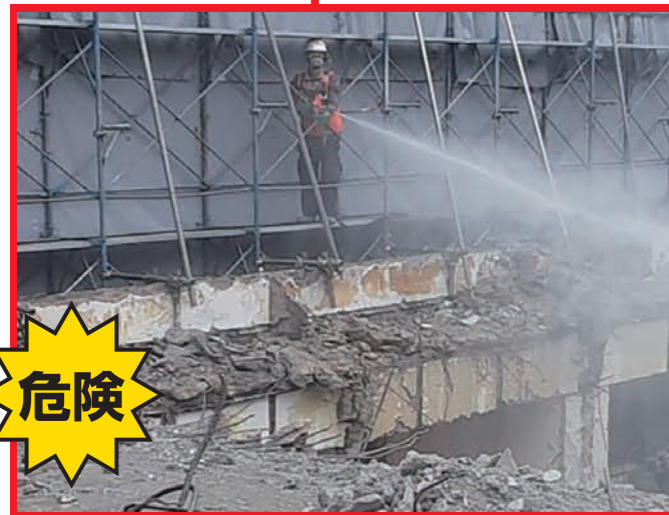
足場の上から散水しており危険