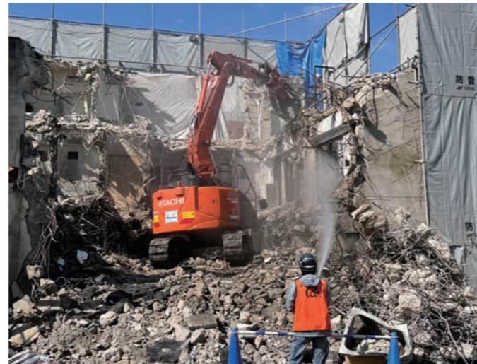
重機の死角エリアからの散水は、がれきがぶつかる可能性もあり危険