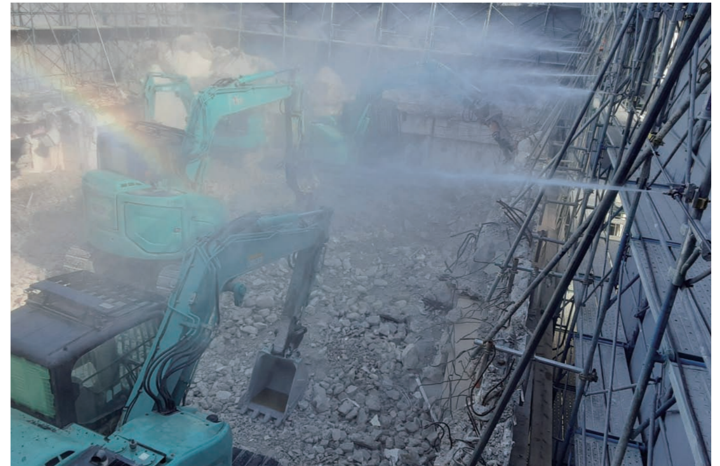
足場上に作業員が立たず安全かつ水の膜を作り粉塵飛散を抑制